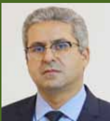
EL MAHDI ARRIFI DG DE L'ADA