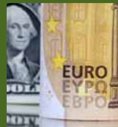
HAUSSE DES BÉNÉFICES VERSÉS À L'ÉTRANGER