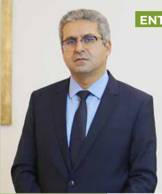
EL MAHDI ARRIFI, DG DE L'AGENCE POUR LE DÉVELOPPEMENT AGRICOLE