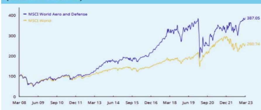
CUMULATIVE INDEX PERFORMANCE – NET RETURNS (USD) (MAR 2008 – MAR 2023)

Au cours de la décennie 2010-2020, l'indice MSCI World Aerospace and Defence a généré un rendement annuel total de 13,8 %, soit le double du rendement annuel de 6,8 % du MSCI World, selon un expert.